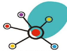
LÍNEA MARCO 3. ESTRATEGIAS PARA LA MEJORA DE LA COMPETENCIA DIGITAL EDUCATIVA.

Esta línea pretende promover la observación, el autoanálisis, la innovación e investigación, la difusión, el intercambio de experiencias educativas y la organización y gestión escolar de éxito, para mejorar la convivencia y seguir caminando hacia la absoluta inclusión e igualdad. Para conseguirlo, la formación del profesorado se orientará a: gestión de centros y liderazgo educativo, proyecto STEAM, diseño, acompañamiento y evaluación de Planes, Proyectos y Programas de Innovación Educativa y desarrollo de los equipos impulsores.