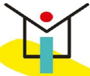
LÍNEA MARCO 2. ESTRATEGIAS PARA IMPULSAR LA INNOVACIÓN EDUCATIVA Y LOS CAMBIOS ESTRUCTURALES EN LOS CENTROS EDUCATIVOS.

Si queremos que el alumnado adquiera estrategias para resolver los problemas reales, desarrolle competencias, habilidades y formación en valores; debemos utilizar metodologías y estructuras organizativas que procuren una nueva forma de aprender: la escuela abierta y participativa, la formación a la comunidad educativa, la actualización científica y curricular del profesorado, la profundización metodológica, el trabajo sobre evidencias científicas, la adquisición de competencias comunicativas en diferentes lenguas y la evaluación del aprendizaje.