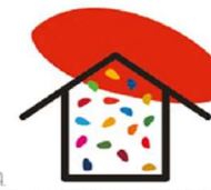
LÍNEA MARCO 4. ESTRATEGIAS PARA LA INCORPORACIÓN DE LOS OBJETIVOS DE DESARROLLO SOSTENIBLE EN EL AULA Y EN LOS CENTROS EDUCATIVOS.

La digitalización cambia la experiencia educativa de toda la sociedad por lo que el profesorado debe saber evolucionar y adaptarse. Se buscará garantizar los derechos educativos de todo el alumnado y profesorado mitigando la brecha digital (tanto en el acceso como en el uso) y procurando asegurar que la tecnología llegue a la mayor parte de la población. Para ello se impulsará la competencia digital e informacional de la comunidad educativa y la creación, utilización y difusión de recursos educativos abiertos.