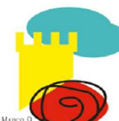
LÍNEA MARCO 9. ESTRATEGIAS PARA EL CONOCIMIENTO DEL ENTORNO CULTURAL Y NATURAL.

Esta línea busca una mejora de los centros educativos ya que desempeñan un papel activo a la hora de proporcionar y garantizar el bienestar social, físico y emocional del alumnado y del profesorado. Para ello se realizarán formaciones sobre espacios; educación socioemocional; salud; prevención; riesgos y hábitos saludables; desarrollo personal, bienestar subjetivo y ajuste social.