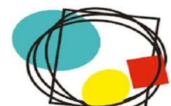
LÍNEA MARCO 5. ESTRATEGIAS PARA LA MEJORA DE LA CONVIVENCIA, LA INCLUSIÓN Y LA IGUALDAD.

La formación dotará al profesorado de las herramientas necesarias para desarrollar un modelo de enseñanza que favorezca el pensamiento crítico, creativo y transformador en el alumnado; y que lo empodere para tomar decisiones conscientes y actuar responsablemente frente a los retos y desafíos que plantean los ODS. La educación, a través de la innovación, la creatividad, la equidad y la evaluación es imprescindible para alcanzar los ODS.