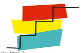
LÍNEA MARCO 10. ESTRATEGIAS PARA EL DESARROLLO Y MEJORA DE LA FORMACIÓN INICIAL Y EL APRENDIZAJE PERMANENTE.

La formación del profesorado acercará la realidad de nuestros entornos culturales, sociales y naturales a toda la comunidad educativa. El profesorado, desarrollando el espíritu crítico del alumnado, creará vínculos entre este y su entorno. Para lograrlo se potenciarán las formaciones que fomenten la conciencia cultural y natural y el respeto por las lenguas propias.